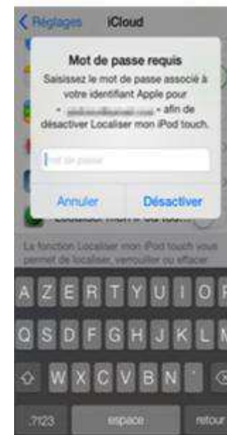
indiquez le mot de passe Apple