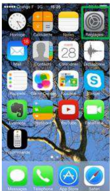
menu « Réglages »

A défaut de désactivation, l'Équipement ne pourra être repris par Orange Business Services.