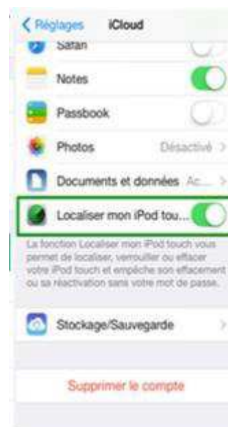
décochez la fonction « Localiser »